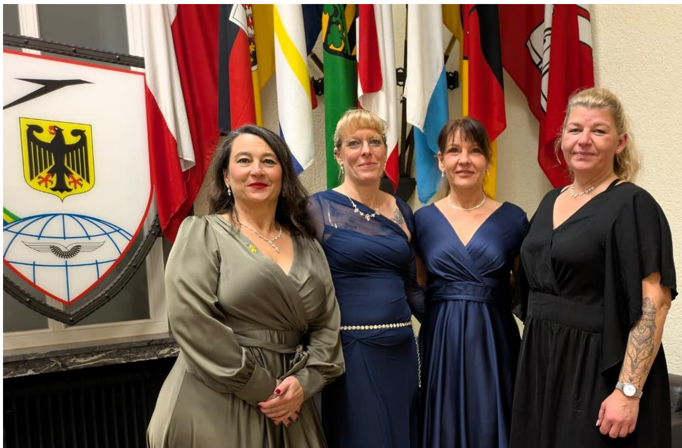
RK Leverkusen Mitgliederinnen, Damenmannschaft „Zündhütchen“

Miteinander und eine starke Organisation vereinte. Die RK Leverkusen freut sich bereits darauf, im nächsten Jahr wieder teilzunehmen.