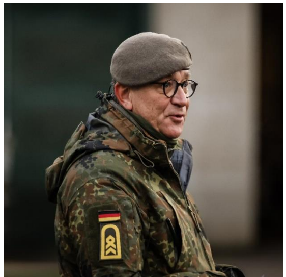
PO Schießen beim Antreten