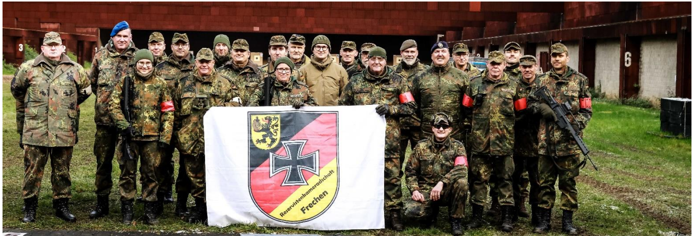
Team Aufsicht Stände G36