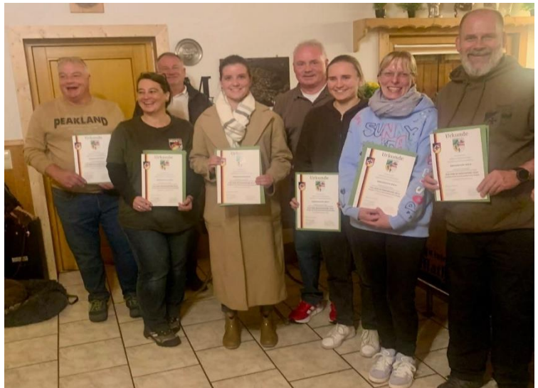
Dankurkunden an Funktionär Tag der Bundeswehr 2025