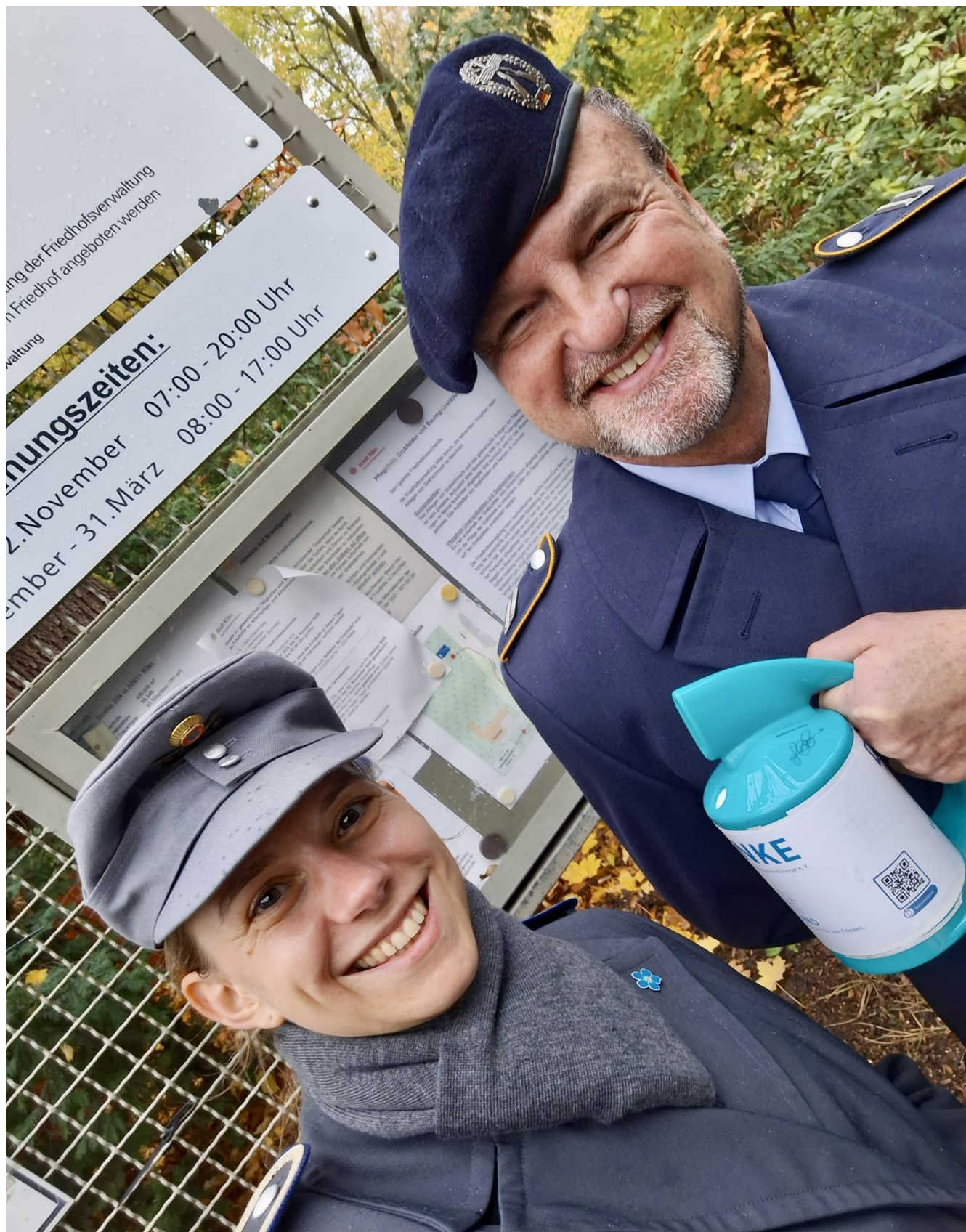
OG d.R. Pingel und Fw (w) Hill