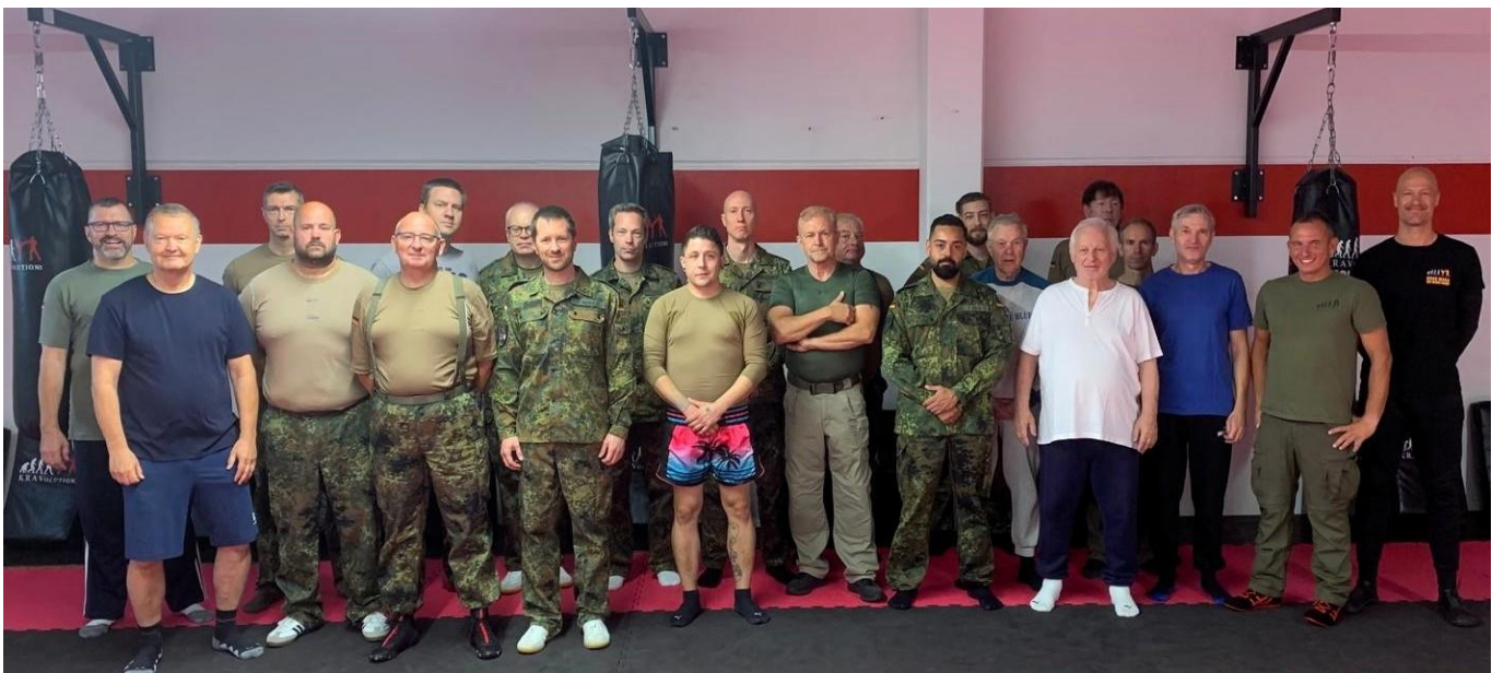
Teilnehmer und Instruktoren