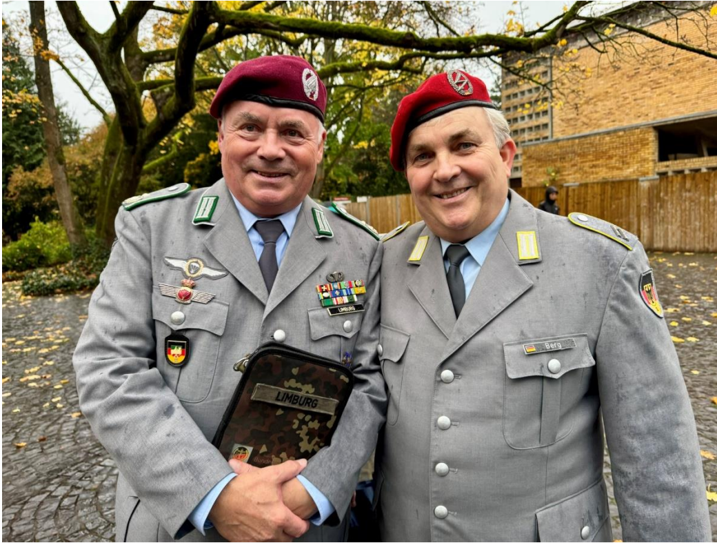
OTL d.R. Limburg und OG d.R. Berg