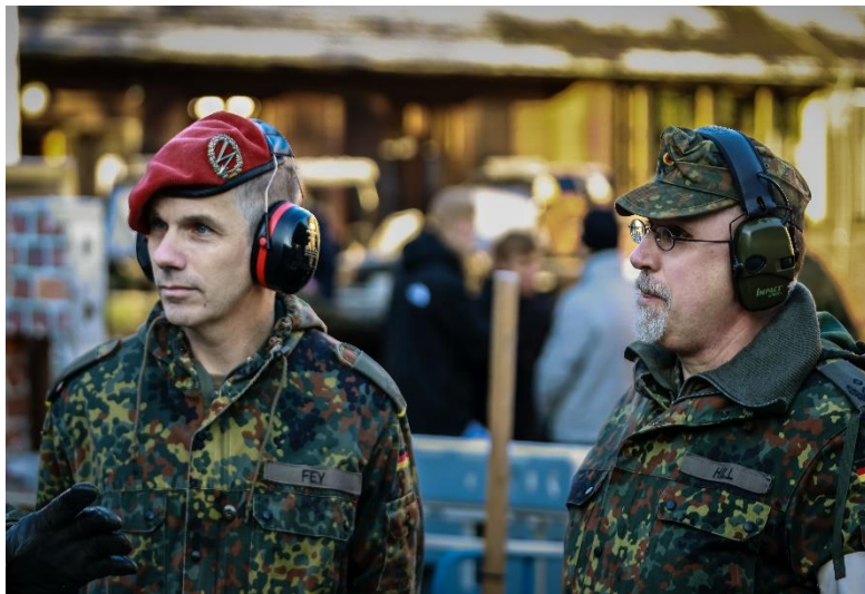
Dienstaufsicht durch das SKA