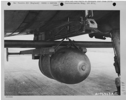
Erster Gleitbombenangriff der USAAF 1944 auf Köln Primitive Abstandswaffen: Gleitbomben

Die Lieferung autonomer, allwetterkampffähiger FlakPz (z. B. Gepard) und FlaRak Systeme (z.B. Patriot) an die UKR hat das Kräfterdispositiv im Ukraine-Krieg verschoben. Um nicht in den Wirkungsbereich der UKR-Flugabwehr eindringen zu müssen, werfen RUS-Kampfflugzeuge Gleitbomben ab. Die Waffe erlebt 80 Jahre nach dem Zweiten Weltkrieg ein unrühmliches Comeback.