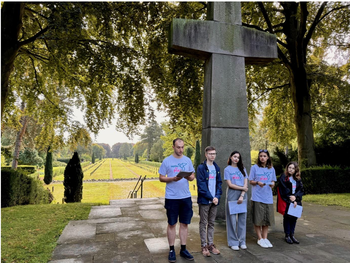
Einer der Vorträge der Jugendlichen, Foto: Limburg