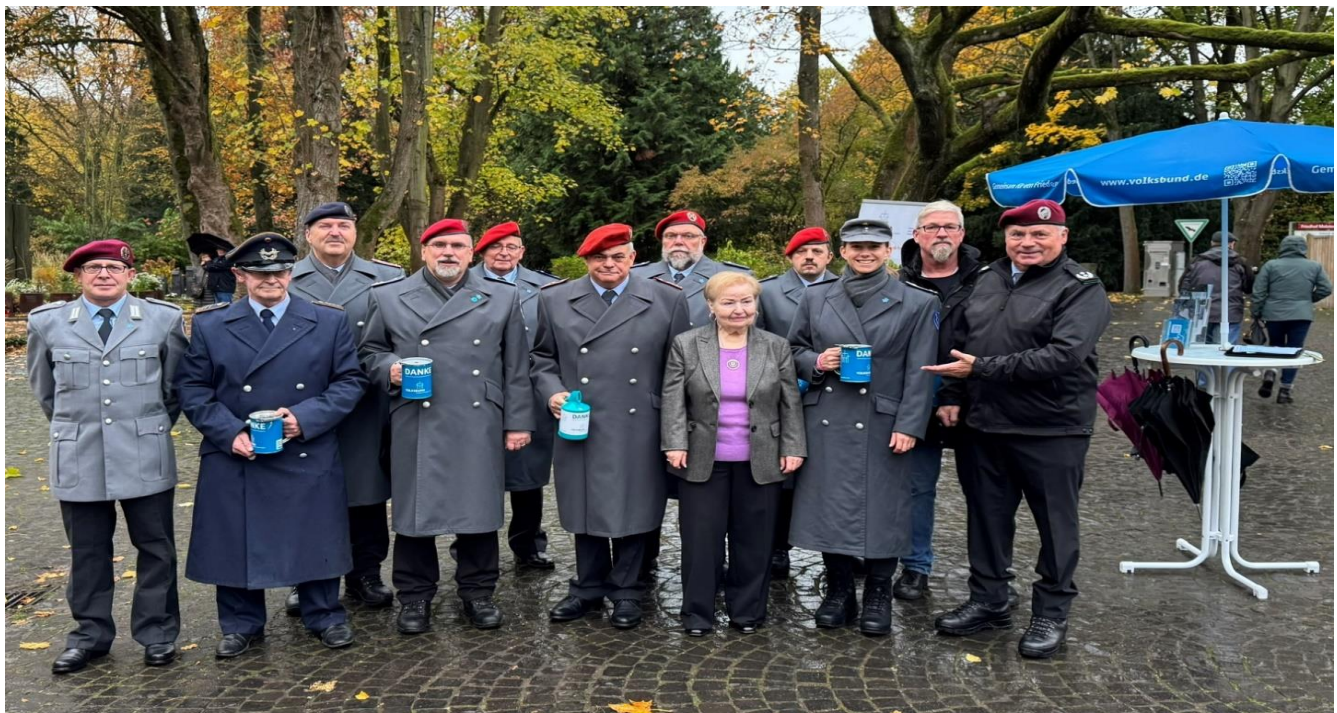
Das Team morgens um 08:30 Uhr, Foto: Regionalgeschäftsführer Stephan-Beneker