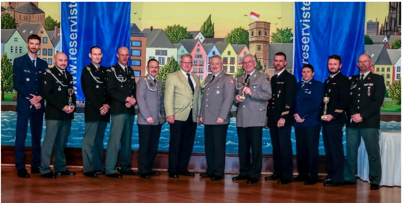
Sieger Teamwertung G36