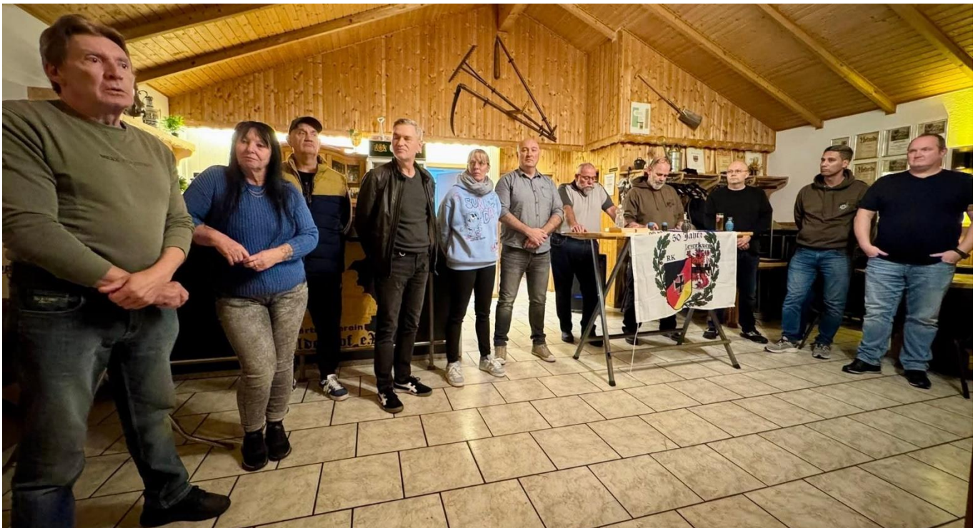
Neue Mitglieder der RK Leverkusen stellen sich vor