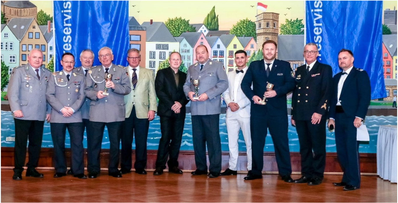
Sieger Teamwertung P8

Die Sieger standen auf der Bühne und wurden für ihre Leistungen geehrt, Gewinner sind alle die dabei waren.