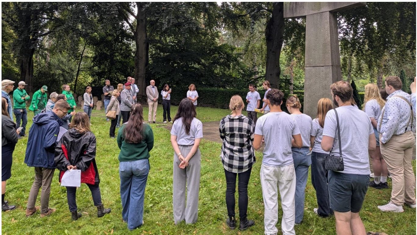
Gäste und Interessierte verfolgten die Beiträge der Jugendlichen